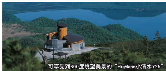
可享受到300度眺望美景的“Highland小清水725”