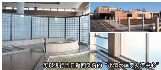
可以进行当日返回洗浴的“小清水温泉交流中心”