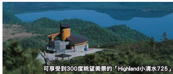
可享受300度眺望美景的「Highland小清水725」