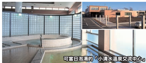
可當日泡湯的「小清水溫泉交流中心」