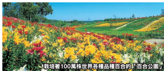
栽培著100萬株世界各種品種百合的「百合公園」